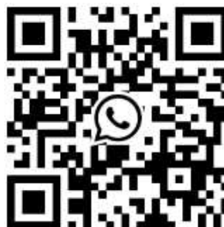
QR – Garantia