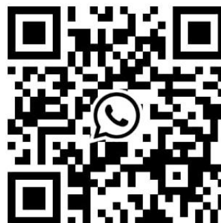
QR – Garantia